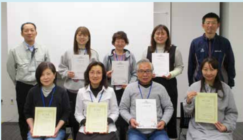
令和6年度ファミリー・サポート協力会員養成講座受講された皆様(修了式)