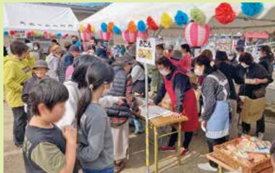
買い物を楽しむ参加者