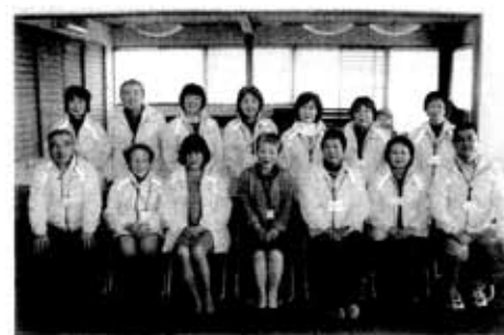
地域サポーター養成講座