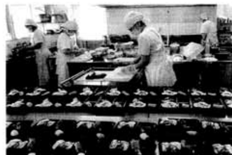
配食サービス事業