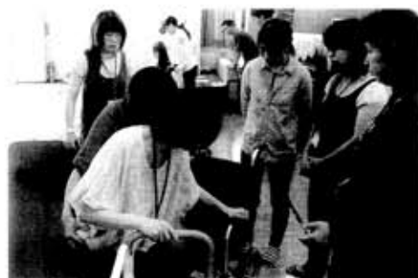
2級ホームヘルパー養成講座

理事会、評議員会の開催 ……………各4回実施 地域福祉活動計画策定 策定委員会の開催…3回開催 ワークショップの開催…2回開催 菊陽町老人福祉センター利用者総数 ……………12,546人 菊陽町福祉支援センター利用者総数 ……………5,460人 ふれあい交流・福祉支援センター利用者総数 ……………15,293人