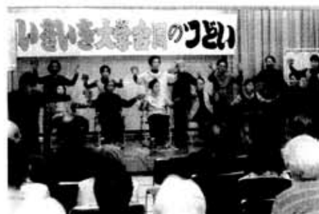
ミニデイサービス事業 合同のつどい