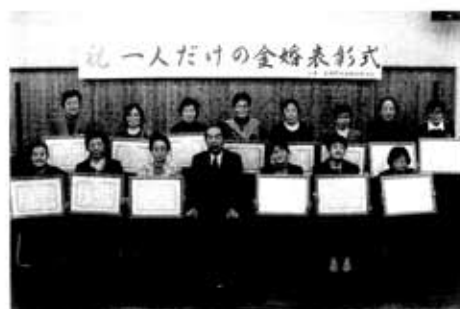
一人だけの金婚表彰式