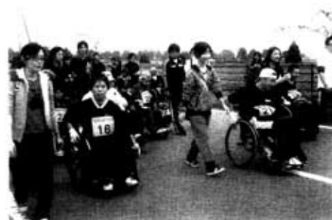
くまもと車いすふれあいジョギング大会 (鉄砲小路農免道路にて)