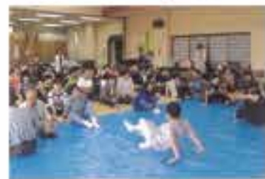
ヒップウォークリレー