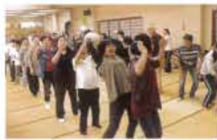
競技のボール運びリレー