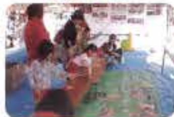
共同募金ゲームコーナー