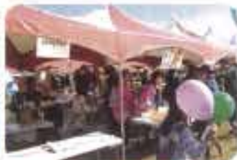
社協自家製のいも神販売コーナー